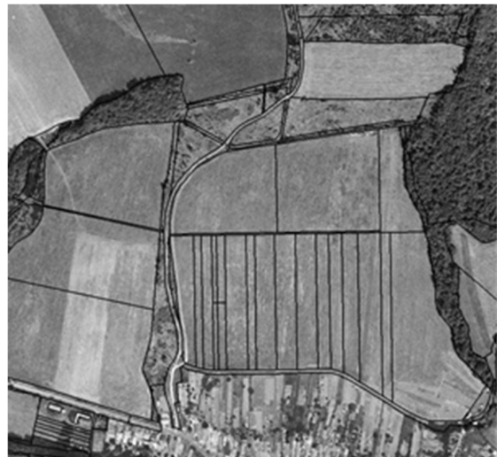
stav po pozemkových úpravách